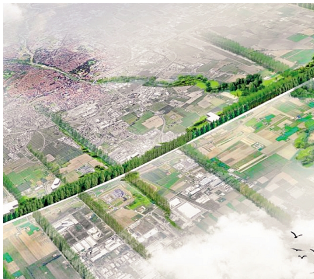
L'ipotesi di mitigazione «verde» della nuova strada a sud di Calusco

«Le strade - aggiunge - vanno fatte con opere di mitigazione ambientale e compensazione che abbiano l'obiettivo di limitare i disturbi e ricucire il mosaico paesaggistico frammentato: il paesaggio e l'ambiente sono beni comuni tutelati dalla costituzione. Ci sono soluzioni a basso costo che è possibile realizzare ai margini delle strade, nei terreni di risulta, dove si dovrebbero strutturare corridoi ecologici, ossia